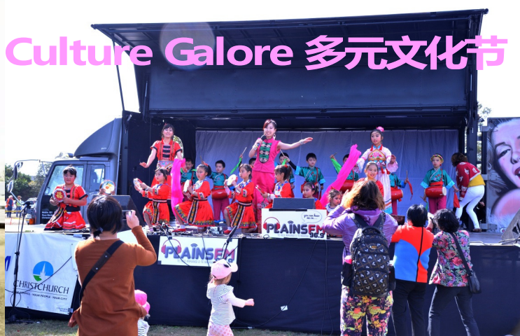
Culture Galore 多元文化节