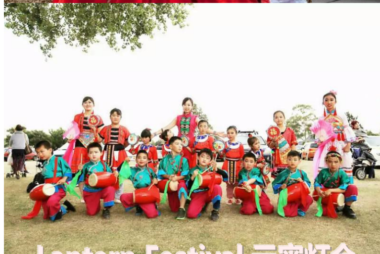
Lantern Festival 元宵灯会